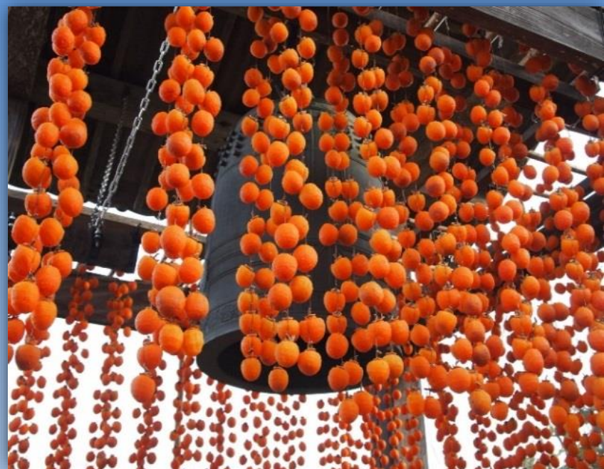
柿すだれ 市田柿