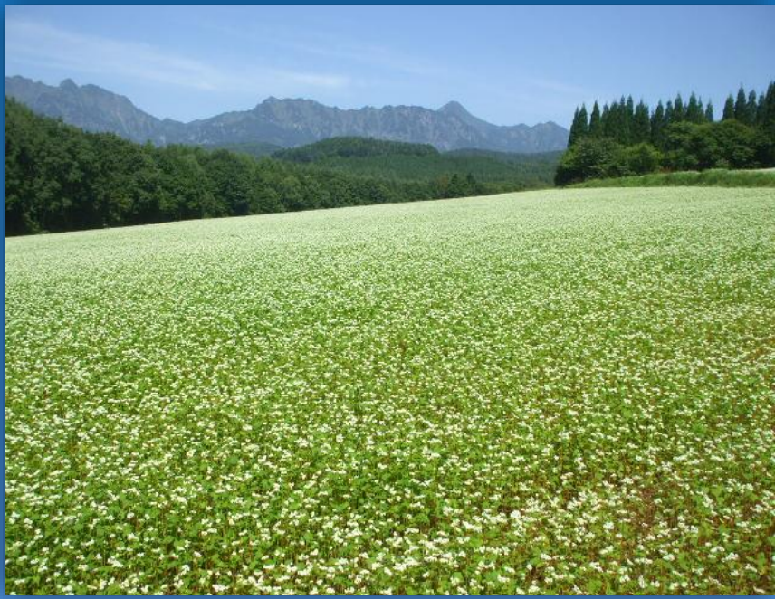
戸隠そば畑