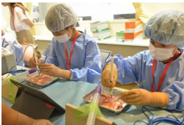
①電気メスによる切開体験